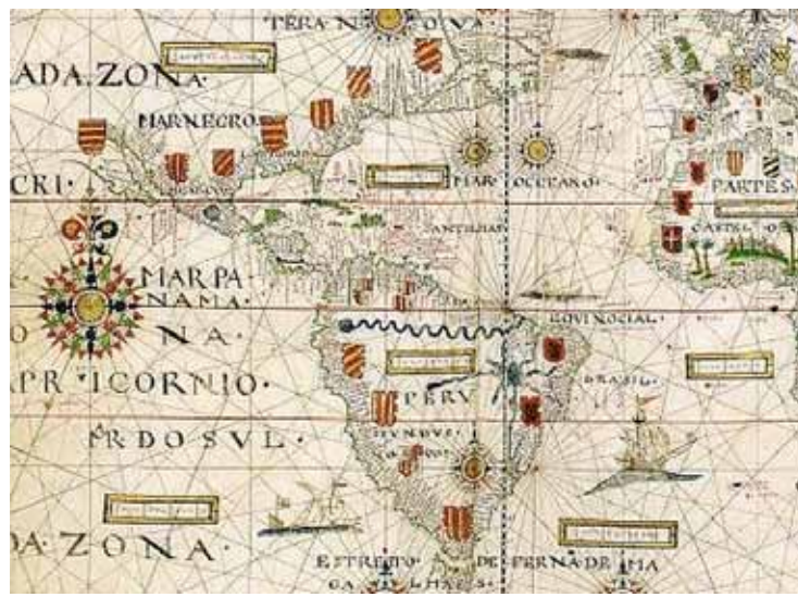
Mapa que mostra, segons Bilbeny, els escuts de la Corona a Amèrica.